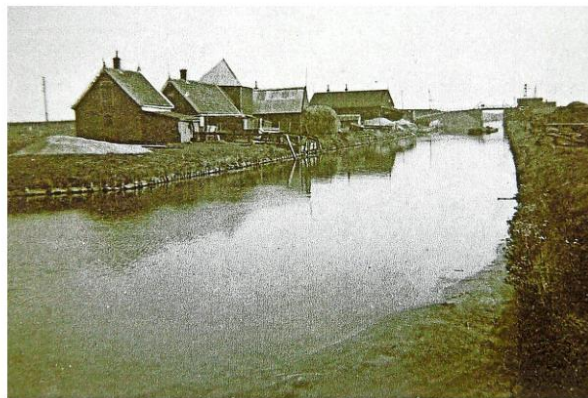
De Leiweg in een grijs verleden met rechts de loswal van het waterschap.

Hij haalt er zijn schouders over op, alsoewel hij het soms jammer vindt dat-ie niet meteen in contact