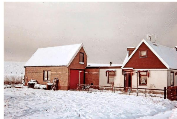
Leiweg 3 met toen nog een kleine tuin.

is daar niet meer, de route ligt nu oostelijk van het buurtje aan de Leiweg. Maar het antwoord op de vraag is hetzelfde gebleven als Toky aan haar man vraagt waar zijn gedachten zijn als hij naar buiten tuurt. Met een brede grijns richting zijn bezoeker: „Net als mijn vader zeg ik dan: 'auto's tellen.'”